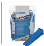
Kliny MapeLevel ProWDG