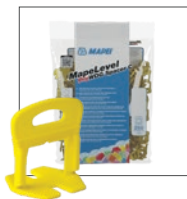
Klipsy dystansowe MapeLevel ProWDG Spacer C Kolorowe klipsy w 7 grubościach dla spoin o różnych szerokościach: 0,5 mm (pomarańczowy), 1 mm (zielony), 1,5 mm (szary), 2 mm (czarny), 3 mm (biały), 4 mm (żółty), 5 mm (czerwony). Do płytek o grubości 3-12 mm.