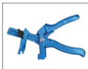
Szczypce MapeLevel EasyWDG Pushing-Pliers